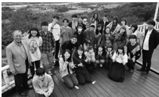
▲音更町内見学中、十勝が丘展望台にて