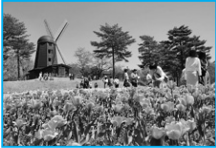
多くの来園者でにぎわいました