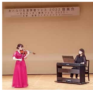
「おとふけ生涯学習フェス2022」の音楽会で演奏しました