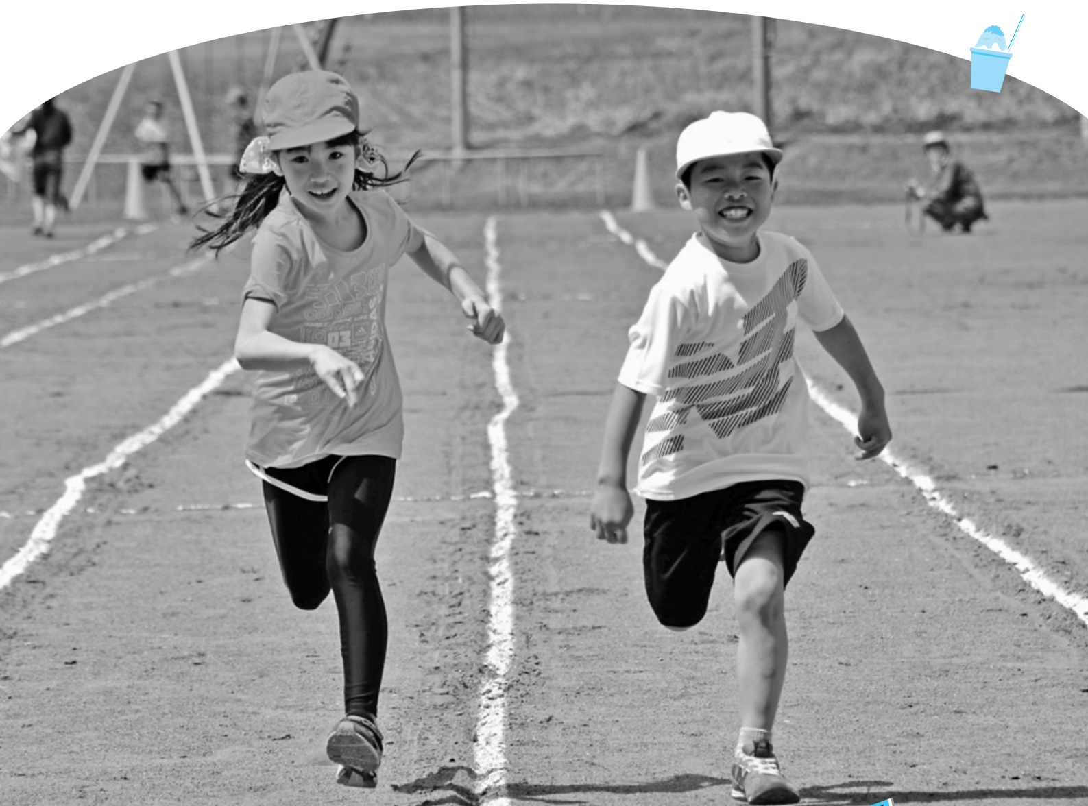
南中音更小学校運動会で力一杯走る児童