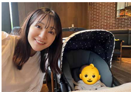
家族で音更に行く日が楽しみです！

どちらが良いと いうわけではあり ません。ただ、私 の大好きな音更の 豊かな自然を我が 子にも触れてほし い。今までよりも 帰省の頻度が上が りつつです。