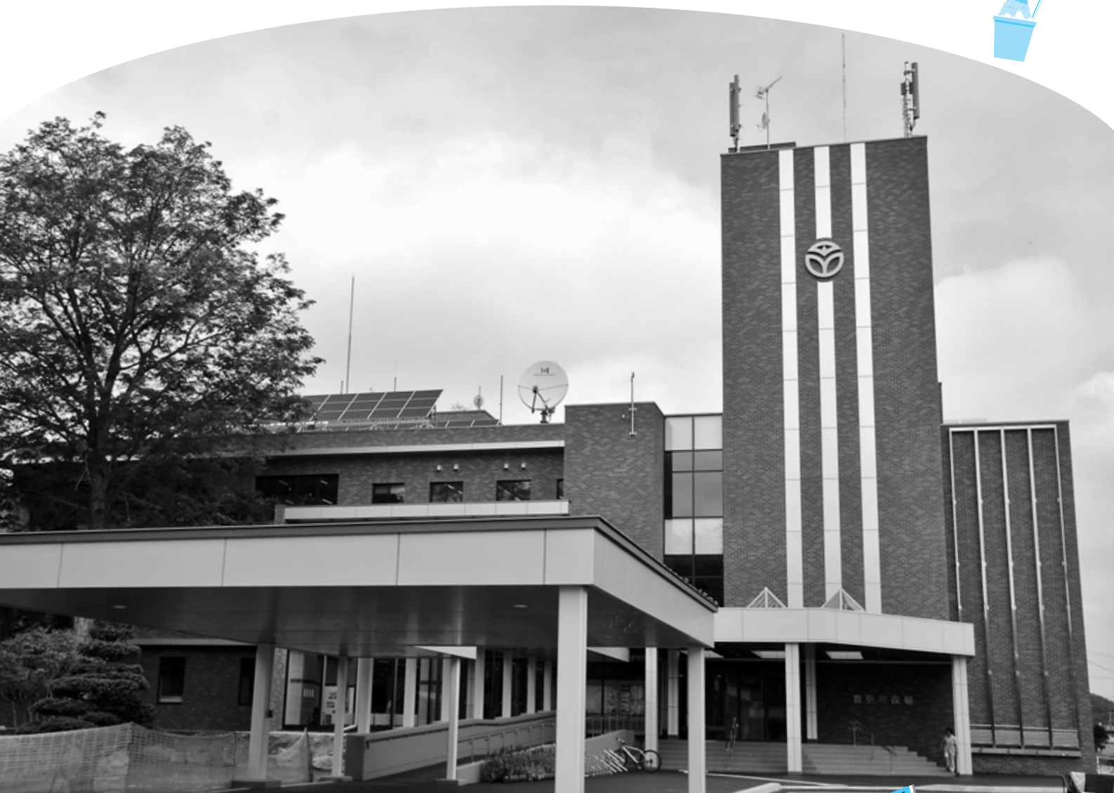
増築棟の供用を開始した役場新庁舎