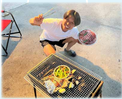
バーベキューをした時の写真です!