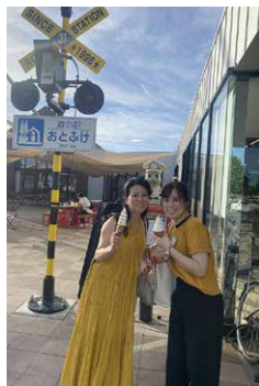
▶セミナー講師の先生と一緒にソフトクリームを食べました！

芸術の秋、今からワクワクしています。食欲の秋でもありますし、秋は楽しみなことがたくさんです。10月も、皆さんが元気で楽しい毎日を送れますように！