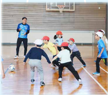
とても盛り上がった試合の様子

します!」と伝えると子どもたちは大盛り上がりでした。男の子も女の子も必死にボールを追いかけ、点を取つたり、試合に勝つと言んでいるのがすごく印象的でした。 今回このような経験をして、また他の小学校でもサッカーを教えたいと思いついた。地域おこし協力隊としての活動も残り1年となったので、できる限り多くの子どもたちに、サッカーを通して運動の楽しさを知ってもらおう活動をしていきたいです。