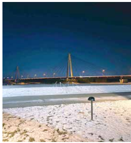
▲温泉帰りに見た白鳥大橋がきれいでした!

「凍れる」という感覚を思い出しています。 おとし、初めて体験した音更の冬は、私の地元網走の冬よりも寒くて驚きました。 「音更は比較的積雪量は少ないけど、びっくりするくらい寒いから気を付けてね」と周りの人から聞いていたのですが、朝晩は本当に寒くてびっくりしています。