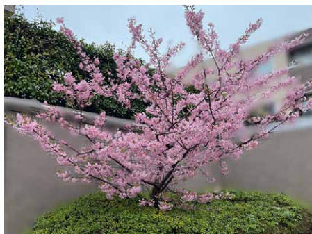
東京では梅の花が咲きました

帰省する時は、懐かしの味を求めていつものお店、いつものメニューを頼む私ですが、次回も新作も食べてみようと思います。東京に帰れなくなるかも！？