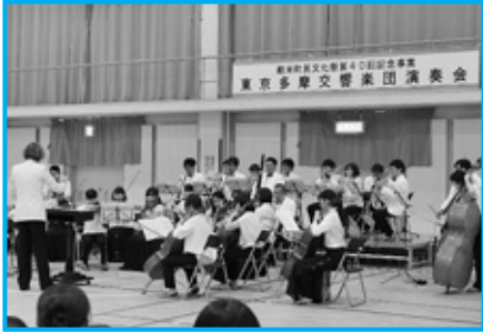
迫力のある演奏に会場は盛り上がりました