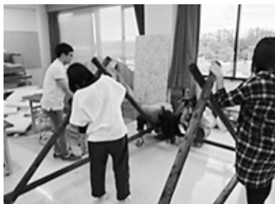
▲木製遊具を製作中の学生たち

造形ゼミでは、表現領域に関する勉強をしています。具体的には、子どもたちの楽しめるおもちゃを考えたりしています。8月に、短大で私たちが制作した遊具で遊んでもらうイベントを企画していますので、ぜひ遊びに来てください。