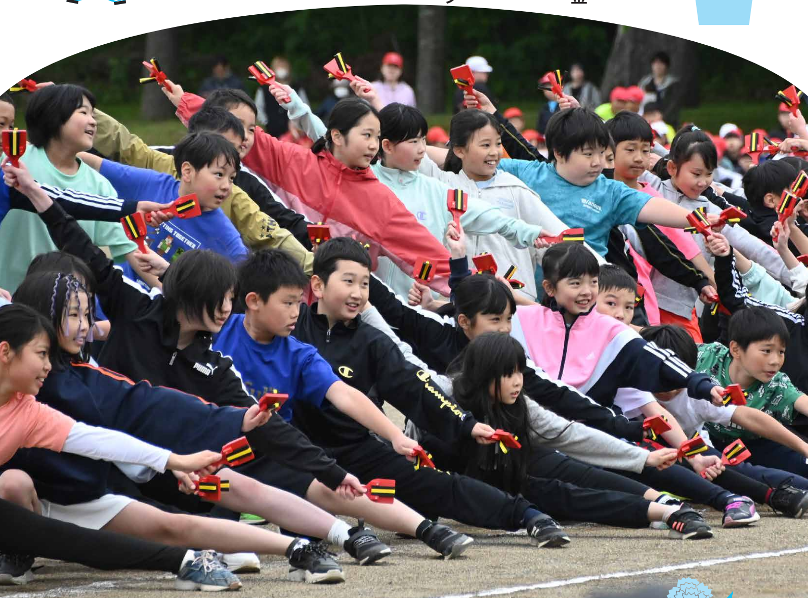
音更小学校運動会でよさこいソーラン節を披露しポーズを決める4年生