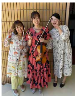
▲音更に来て初めて出会った音楽家のお二人と♪