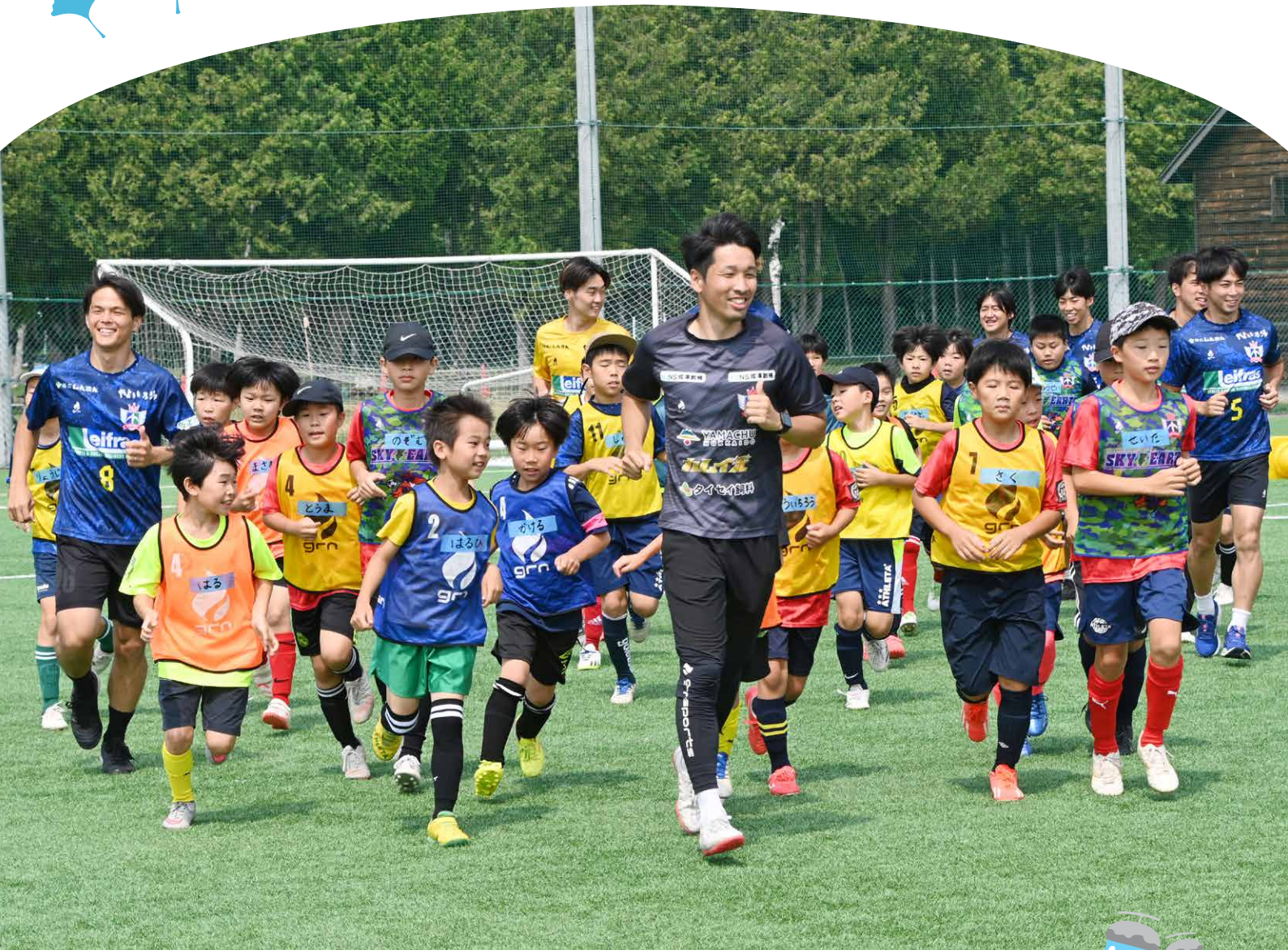
スカイアースサッカーフェスティバルで憧れの選手たちとランニングをする子どもたち