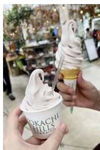
▲ソフトクリーム最高でした!

ちが込み上げてきました。私は、多くの人の支えで仕事としてバイオリンを弾き続けることができているのですが、5歳から始めたバイオリンを一番長く応援してくれた両親には、誰よりも特別な感謝の気持ちがあります。私が選んだ道を見守り続けてくれた両親のおかげで、今こうして音更で暮らすことができていることに、改めて感謝の気持ちでいっぱいになりました。地域おこし協力隊の任期が終了したら、またゆつくり遊びに来てほしいと思います。 さて、芸術の秋到来! 気合を入れてがんばるぞー!