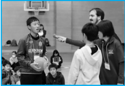
英語を使って自分の思いを発表