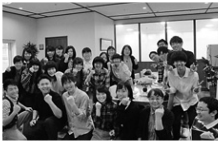
▲研修終了後にみんなで記念撮影

ものだそうです。地域にとつてなじみ深い施設となるよう、建設前から地域と関わり、意見を反映させていきました。研修では共生施設と地域の関係性を学ぶことができました。どのようになると施設と利用者、地域が共生することができのかを今後も考え、研修で学んだことを活かして、利用者が地域で過ごしやすくと感じるような支援をしていきたいです。